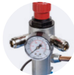
FLEXIBILITÉ DE FONCTIONNEMENT